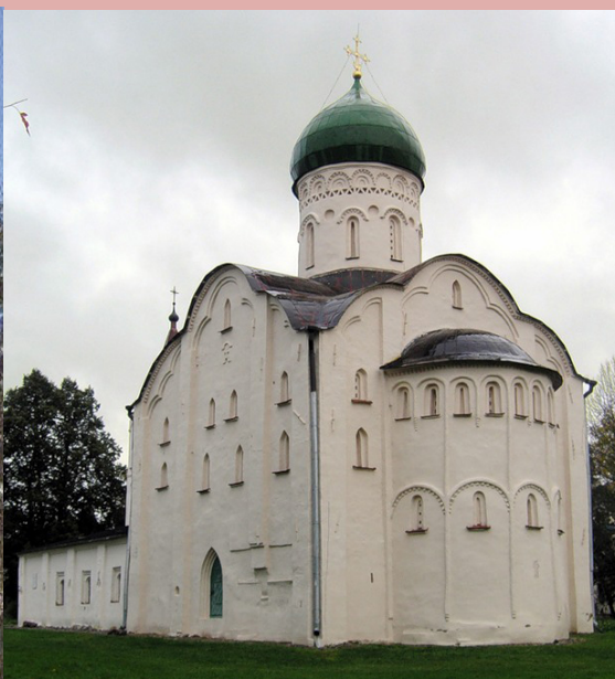
. 145. Церковь Федора Стратилата на Ручью. 1360-1361 гг.

Однако апогей развития новгородского стиля по праву связывается с . Тут новгородские мастера не поскупились на детали, обильно украшающие поверхность стен.— фигурные завершения оконцев, чередующихся по размерам, перспективные профили, аркатурные пояса , разнообразные тяги , скульптурные кресты, выполненные в низком рельефе. Кажется, что здесь в полной мере проявил себя и народный вкус к украшательству и «узорочью», который, при всей своей замысловатости, не теряет связи с архитектурной формой.