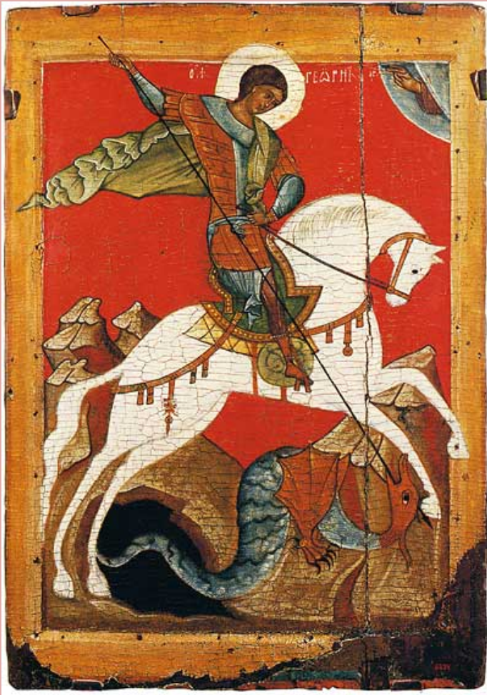
. 150. . Кон. XIV-нач. XV вв. 58x41,5 см Государственный Русский музей.

Между тем народная линия в иконописи Новгорода не была единственной, хотя количественно, безусловно, доминировала. Ряд живописных памятников будто бы выпадает из общего контекста местного станкового искусства, свидетельствуя о его большой разнообразии. В образе Богоматери Донской чувствуется рука большого мастера, который далек от новгородских иконописцев. Насыщенными, с большим вкусом подобранными цветами, он тклет красочный слой иконы подобно драгоценной парче, которая составляет достойное обрамление Царице Небесной, в чьем лице нет ничего от недостижимого совершенства. Черты ее далеки от абстрактного идеала, и словно идут по плавной дуге, подчиняясь округлому абрису композиции.