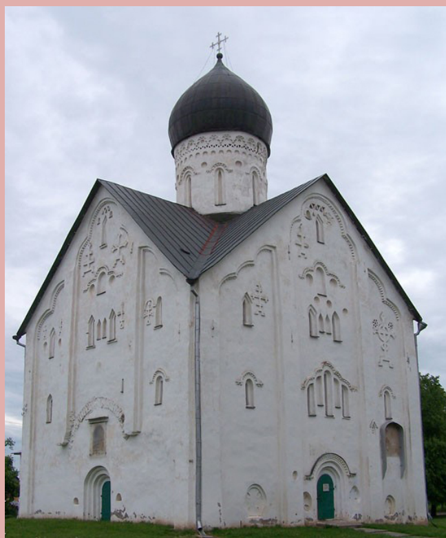
. 146. Церковь Спаса Преображения на Ильине улице. 1374 г.