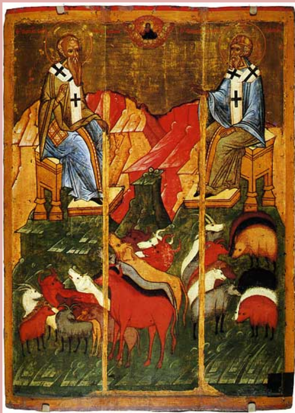
. 148. Св. Власий и Спиридон ок. 1407 г. 117,5x85,5 см. Государственный исторический музей.

покровителей скотоводства, Илья Пророка – ниспослателя дождя, св. Георгия – стража новгородских границ, св. Флора и Лавра, отвечавших за коноводство, св. Параскевы Пятницы и Анастасии, помогавших в торговле. Порой на этих иконах святые изображаются в окружении своих «подопечных». Св. Власий и Спиридона часто сопровождают пасущиеся на тучных лугах стада, с прилежанием внимающие своим охранителям.