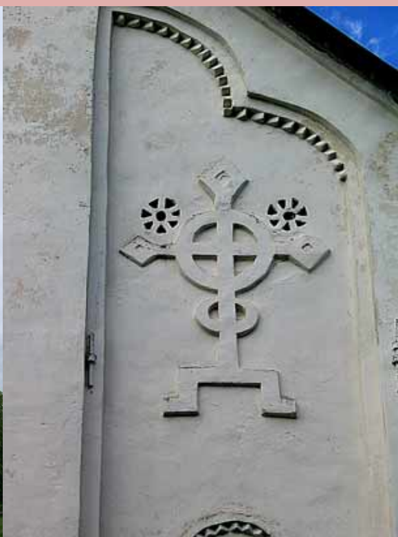
. 147. Церковь Спаса Преображения на Ильине улице. Деталь оформления фасада.

Станковая живопись в новгородской республике была самым демократичным искусством. Строительство богато украшенных церквей и исполнение росписей были способны окупить только духовенство, родовитое боярство и зажиточные купцы, искушенные в тонкостях толкований Священного Писания и неплохо знакомые с византийскими прототипами. В то же время заказ небольшого образа святого , соименного заказчику или выступающего патроном его ремесла, являлся в Новгороде делом обычным и доступным, отражая не слишком рафинированные вкусы простых жителей.