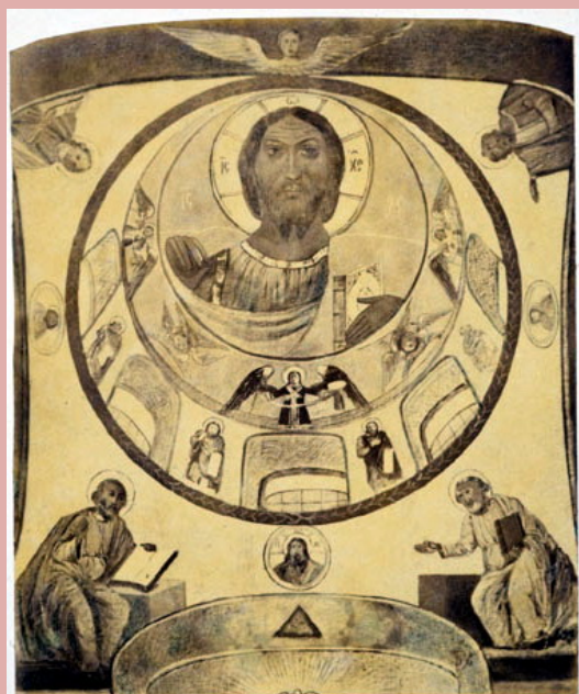
. 100. Купол храма св.Софии в Новгороде. Разрушен в 1941 г.

Показательно, что в храме св.Софии в барабане расположены образы пророков, а не апостолов, как в Киеве, где все пространство пронизано темой апостольства и обращения в христианство.