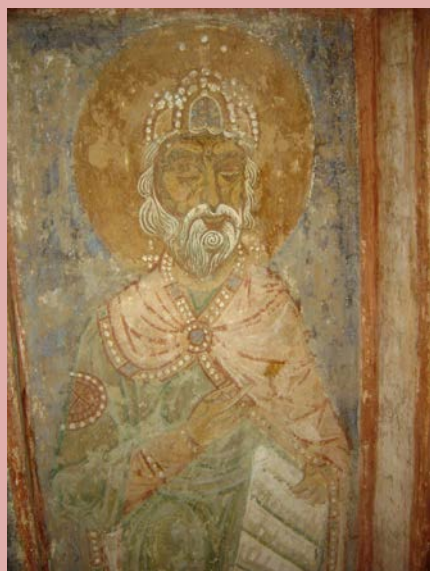
. 116. Образ пророка в Спасо-Преображенской церкви Евфросиньева монастыря.

В целом необходимо отметить, что помимо изображения праздников, здесь представлено бесчисленное множество преподобных, что было чрезвычайно важно для небольшого монашеского храма.