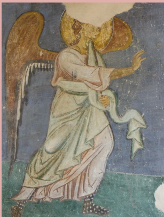
. 108. Архангел Гавриил из сцены «Благовещения». Рождественский собор Антониева монастыря.

Фигура лишена статичности, напротив, здесь есть порывистость движения, которая чувствуется в каждой складке драпировок. В дополнение к этому заметно усиление индивидуализации образов, что особенно выделяется в