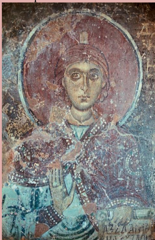
. 101. Пророк Даниил в барабане храма св. Софии в Новгороде.

Показательно, что в храме св.Софии в барабане расположены образы пророков, а не апостолов, как в Киеве, где все пространство пронизано темой апостольства и обращения в христианство.