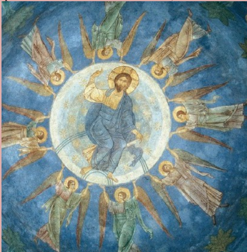
. 110. «Вознесение» в куполе Спасо-Преображенского собора Мiroжского монастыря.

Но если в Старой Ладогe фрески этого периода не сохранились, то в Пскове до нас дошли росписи , выполненные около 1240 г.