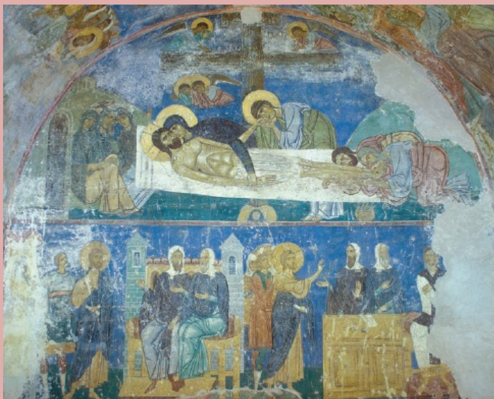
. 111. «Оплакивание» в Спасо-Преображенском соборе Мирожского монастыря.