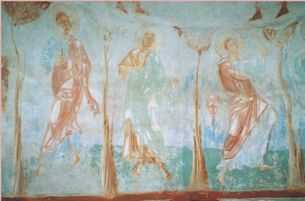
. 112. Апостолы из сцены «Вознесения» в куполе ц.св.Георгия в Старой Ладогe.

Сравните апостолов из сцены «Вознесения» с образами ангелов из собора Мирожского монастыря. Видите ли Вы разницу?