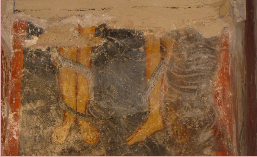
. 106. Фрагмент композиции «Страшного Суда» в Николо-Дворищенском соборе Новгорода.

Как отдельное явление в искусстве Новгорода необходимо рассматривать монументальную роспись Рождественского собора Антониева монастыря. Этот один из первых монастырей на Новгородской земле был основан , и им же была заказана роспись собора в 1125 г.