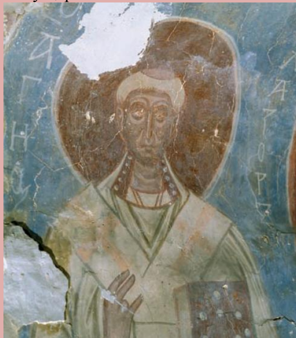
. 105. Св.Лазарь из Николо-Дворищенского собора Новгорода.

Еще один фрагмент находится в алтарной части, и на нем представлен образ св.Лазаря. Появление здесь образа этого святителя можно связать с желанием князя Мстислава почтить память своего духовника – киевского архимандрита Лазаря, у которого небесным покровителем был именно этот святой. Таким образом, в храмах часто отображаются те исторические события, которые сопровождали постройку церкви.