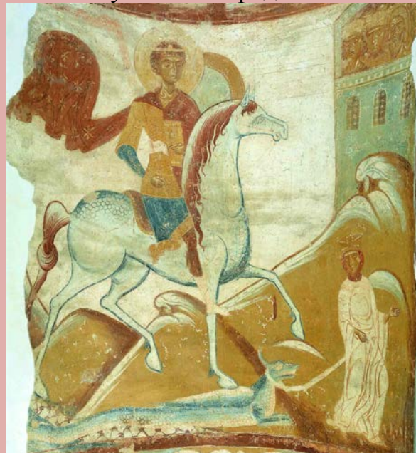
. 113. Образ св. Георгия в ц.св. Георгия в Старой Ладогe.

Особенно знаменит храм в Старой Ладогe образом . Впервые в древнерусском искусстве он представлен в такой иконографии.