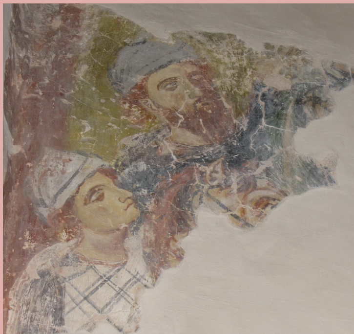
. 109. Волхвы. Рождественский собор Антониева монастыря.

В целом, роспись достаточно традиционна, в том числе отображается новгородская особенность, т.е. включение двухрядного святительского чина.