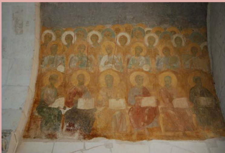
. 117. « » .

И совсем иное художественное направление мы встречаем в